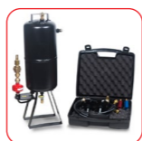
Kit de nettoyage