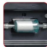
Analyseur de gaz HFO ou R134a