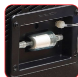
Analyseur de gaz