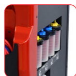
4 lignes séparées