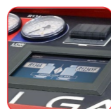
Écran tactile couleur 7"