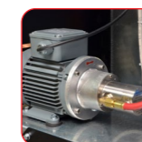
Pompe à engrenages