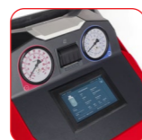
Écran tactile couleur 7"