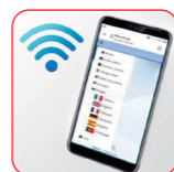
Connectivité SANS FIL