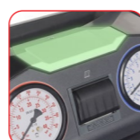
Témoin lumineux d'état