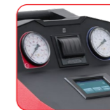
Écran tactile 4,3"