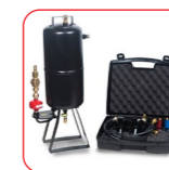
Kit de nettoyage