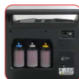
Réservoirs hermétiques et rechargeables