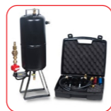
Kit de nettoyage