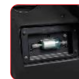
Analyseur de gaz HFO ou R134a